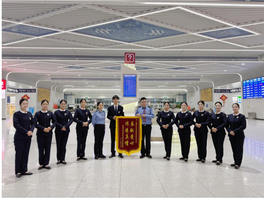
（南通西站颁发感谢锦旗）

发挥了自己的专业价值，收获了来自旅客们由衷的感谢和南通西站的高度肯定，用热诚与专业为南通铁路客运服务贡献青春力量。